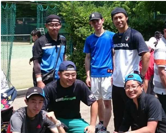
男子代表選手の皆さん